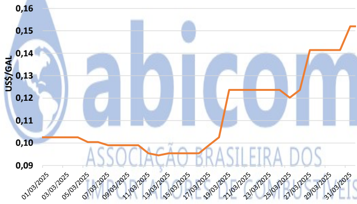
Frete Marítimo - Golfo (EUA) x Sudeste (BR)