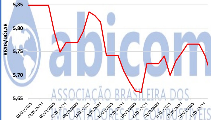
Taxa de Câmbio